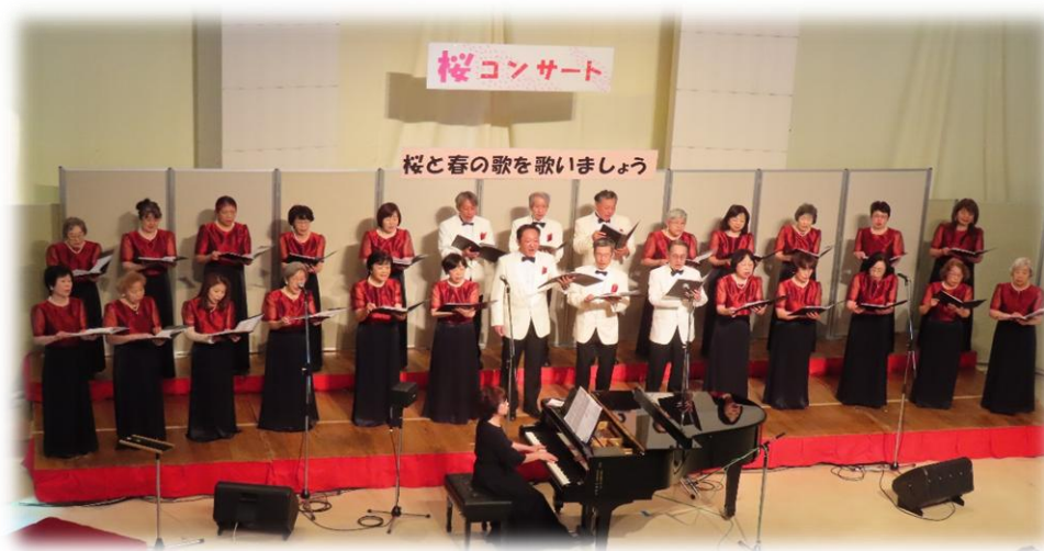
以前のコンサートより